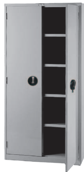
EF-36D H1760xW900xD465 产品内容：活动棚板4片