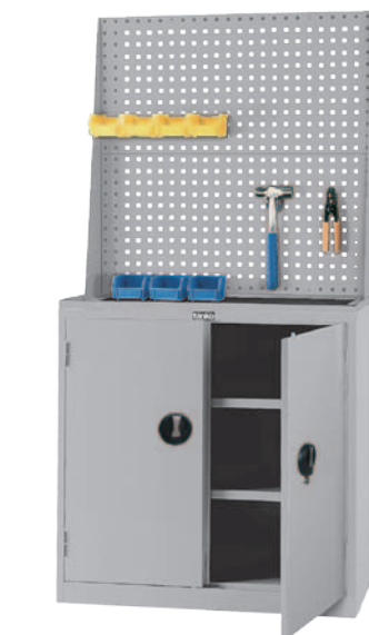
EF-33D+KQ62 H1788xW900xD465 产品内容：挂板一组+活动棚板2片 (不含陈列工具与塑胶盒)