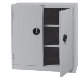
EF-33D H880xW900xD465 产品内容：活动棚板2片